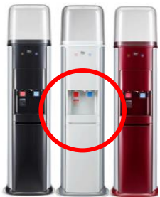
床置き型(JL)サーバー

△注意： リングは 1つだけ セットして下さい。お手元に2個届いた場合は、1つは予備として保管して下さい。