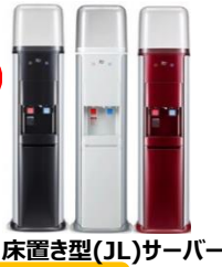
床置き型(JL)サーバー

床置き型(JL)サーバーご使用中、まれに水が出なくなる等の不具合が発生することがございます。 不具合防止のため、差込口を水気のない清潔な状態にし、差込棒にボトルセット補助リング(以下リング)をセットして下さい。 (差込棒に通すだけでOK！) その後ボトルをセットして下さい。